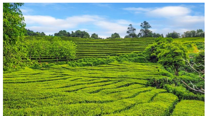
Teeplantage bei Gorreana auf der Insel São Miguel