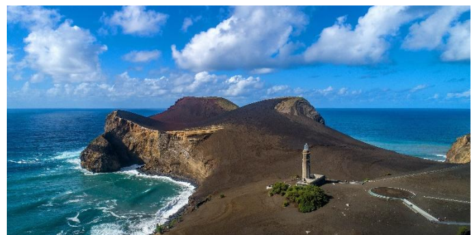
Vulcão dos Capelinhos