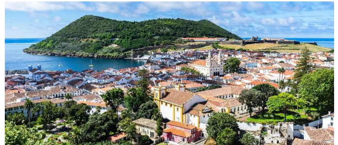
Angra do Heroísmo