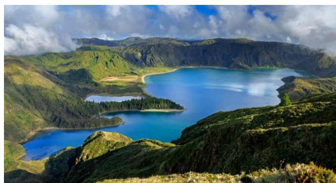
Lagoa do Fogo