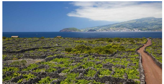
Weinanbau auf Pico