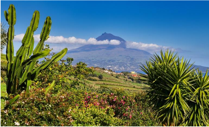
Vulkan Pico auf der Insel Pico